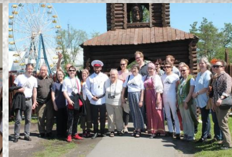
Туристический маршрут «Уездный город на Сибирском тракте» туристы из Германии, Финляндии, Казахстана

Подписано долгосрочное соглашение с кафедрой туризма и гостиничного дела института дизайна и технологий Омского политехнического университета