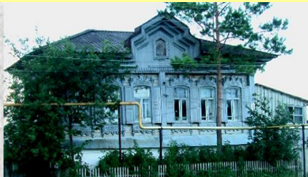
Жилой дом по ул. П. Усольцева