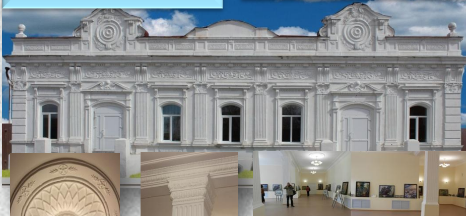
помещения магазина купца Афонина (1905)- ныне Центр народного творчества