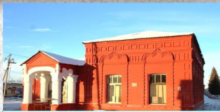
Памятник архитектуры 1906 года постройки, в котором располагалось Офицерское собрание